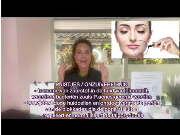
https://youtu.be/xtjdtcc7zhw ( You tube film Biopulse Therapie Miranda Keijzer)